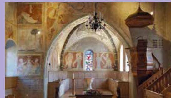
Innenansicht Kirche Erlenbach im Simmental

17.00 Uhr Ankunft beim Hotel Eden, Spiez